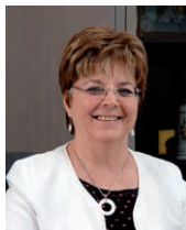
Dominique Chauvel Maire de Saint Valéry en Caux