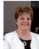
Dominique Chauvel Maire de Saint Valery en Caux